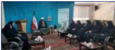
دیدار جمعی از فعالان حوزه جمعیت مرکز بهداشت شهرستان سمنان با امام جمعه شهرستان سمنان ۱۴۰۴/۰۳/۰۵