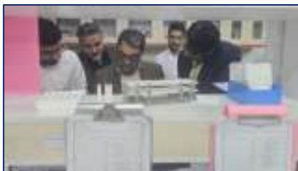
بیمارستان معتمدی گرمسار، مقصد نخستین بازدید میدانی سرپرست دانشگاه علوم پزشکی استان سمنان ۱۴۰۴/۰۳/۰۶